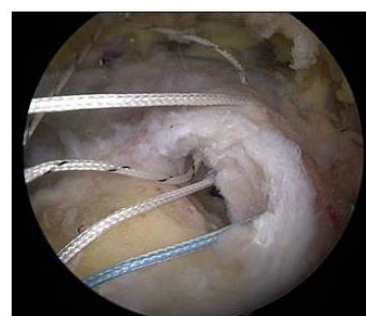
Rééducation post-chirurgicale de la coiffe des rotateurs Certitudes, Idées reçues et Retour d'expérience.

Inscription gratuite par Email : epaule.grenoble@gmail.com